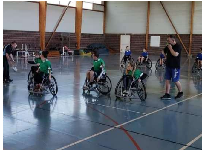
Rugby XIII Fauteuil

2021 : 14 D emos et sensibilisations pour 362 Participants